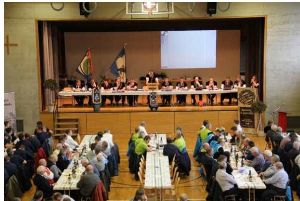
DV des Luzerner Kantonalen Schwingverbandes in Hohenrain